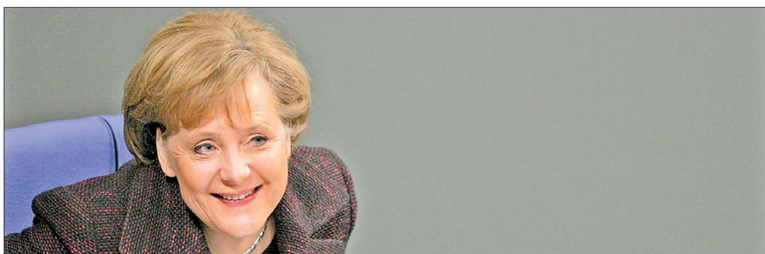
Genießt ihre Kanzlerschaft: Angela Merkel hat allen Grund zum Lachen. Sie ist derzeit die beliebteste Politikerin Deutschlands.

Wann jemals hat man Angela Merkel so locker vom Hocker mit Journalisten plaudern sehen, wie auf dem Rückflug nach ihrem Moskauer Antrittsbesuch? Schleierhaft sei ihr, lästerte sie da, weshalb Russlands Präsident Wladimir Putin bei jedem kritischen Thema in unendliche Monologe flüchte, stets „den ganzen Sermon“ aufzische und nicht auch mal die Klappe bremsen könne. Stolz über sich selbst lächelnd, verrät sie, wie sie den Russen beim kritischen Thema Tschetschenien ausbremsst hat: „Ich habe den Konflikt erst fünf Minuten vor Ablauf unserer Gesprächszeit angesprochen.“